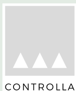
6.4 Controlla AG, Frauenfeld Revisionsstelle (bisher)

Der Vorstand beantragt Ihnen die Wahl von oben aufgeführten Personen in den Vorstand der Genossenschaft Sunnezirkel sowie der Revisionsstelle Controlla AG.